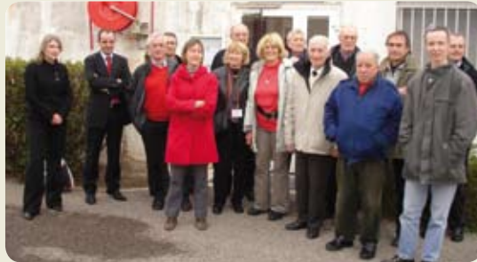
Visite de l'usine de Fos-sur-mer – Club des Actionnaires – 5 février 2009

Si vous souhaitez recevoir systématiquement toutes les prochaines lettres aux actionnaires, contactez-nous à l'adresse suivante : actionnaires-individuels@arkema.com ou au N° Vert 0 800 01 00 01