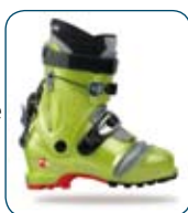
Chaussure de ski en Pebax® Rnew