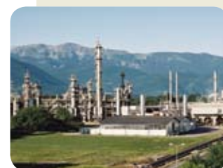
Usine de Lannemezan - France